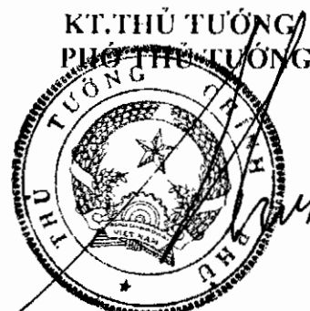
Nguyễn Sinh Hùng